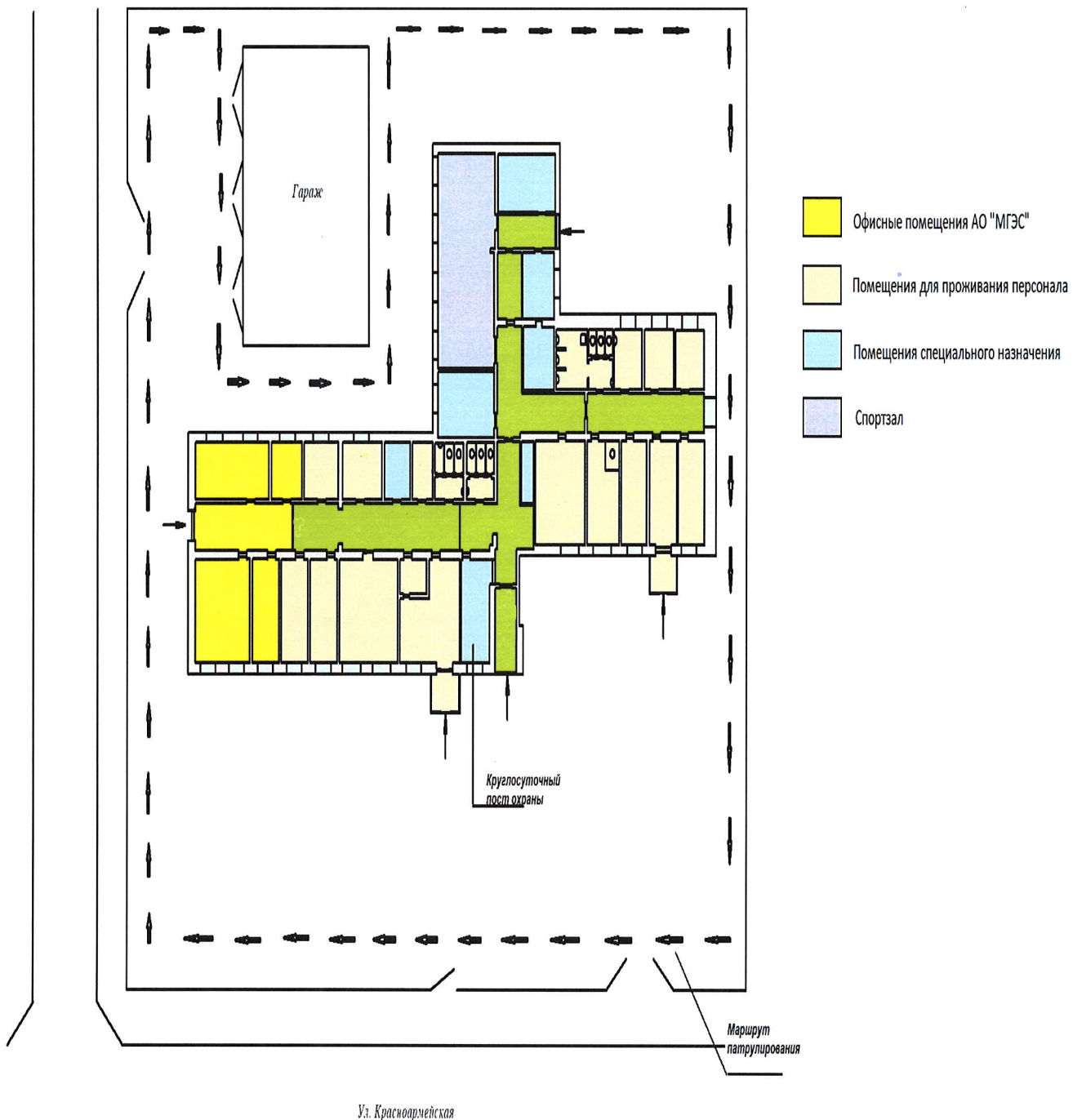
Схема обозначения зоны ответственности Исполнителя для обеспечения режимов, установленных Заказчиком.